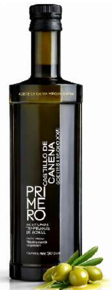
ACEITE DE OLIVA VIRGEN EXTRA