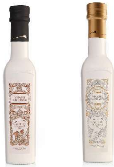
Vinagres balsámicos de origen selecto