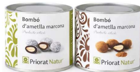
Bombó d'ametlla marcona artesans de Priorat Natur